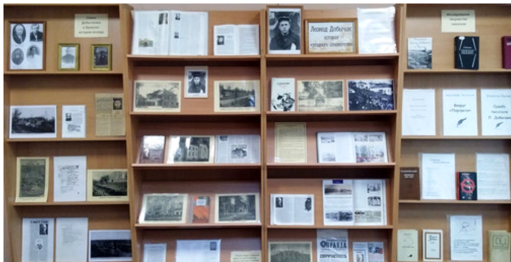
Выставочный проект «Леонид Добычин: история уездного сочинителя»